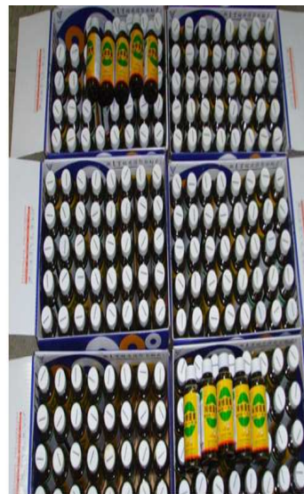
무등록 밀수 농약(아바멕틴)